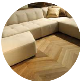
Finitura a vernice