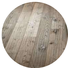
Finitura ad olio