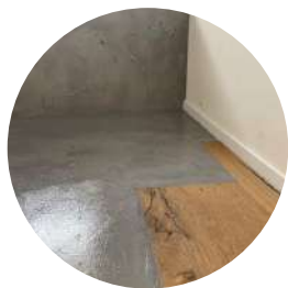
Resina e microcemento